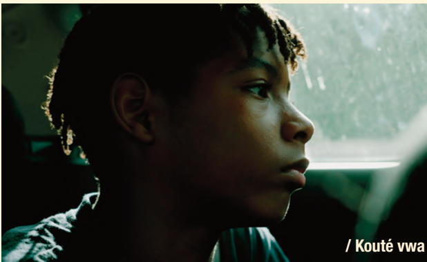
/ Kouté vwa

MER-30 AVRIL | 19H30 | QUAI M.NDIAYE | PLEIN AIR