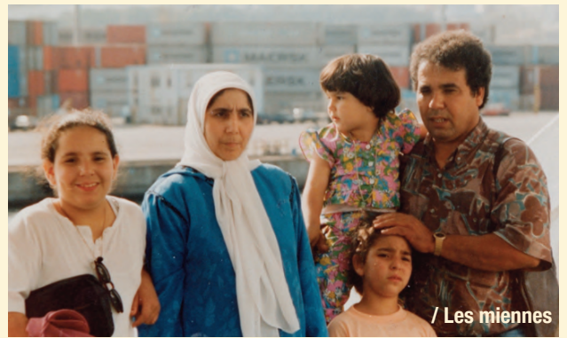
/ Les miennes